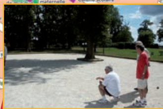
Bouldrome Parc de Burladingen 86, avenue Ardouin