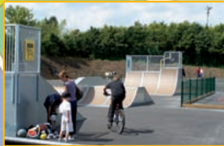
Espace Sportif de Plein Air 19, avenue de l'Europe