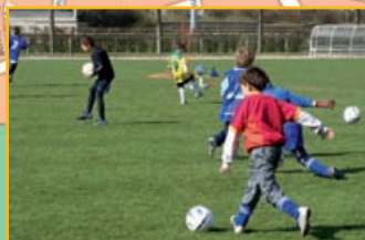
Stade Louison Bobet 169, av. Maurice Bertheaux Tél. : 01 45 76 60 98