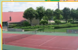
Club de Tennis 17, avenue de l'Europe Tél. : 01 45 76 82 02

Domaine agricole régional du Plessis-Saint-Antoine