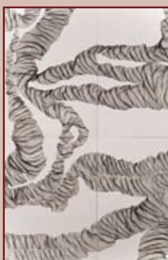
Œuvres de Letizia Giannella

L' exposition du mois de décembre qui clôturera l'année 2015 propose un regard croisé entre Artistes et Artisans. Deux notions proches l'une de l'autre et qui exigent de la part de celles et ceux qui l'exercent une maîtrise technique, une connaissance du geste juste. Dans un monde secoué par la violence, prenons le temps de découvrir au château des Tourelles des êtres humains dont le seul but est de nous toucher en produisant en nous de belles émotions.