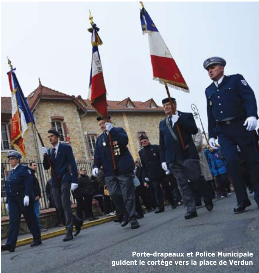
Porte-drapeaux et Police Municipale guident le cortège vers la place de Verdun

Les enfants regroupés devant l'espace Georges Roussillon ont chanté l'Hymne national a cappella