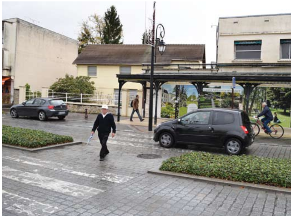
Bel exemple de partage de l'espace urbain

Comme nous l'indiquions au début de cet article, la « zone 20 » aide au développement de la vie locale.