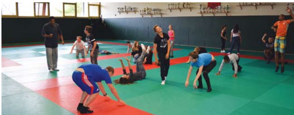
Séance sportive pour les 11-15