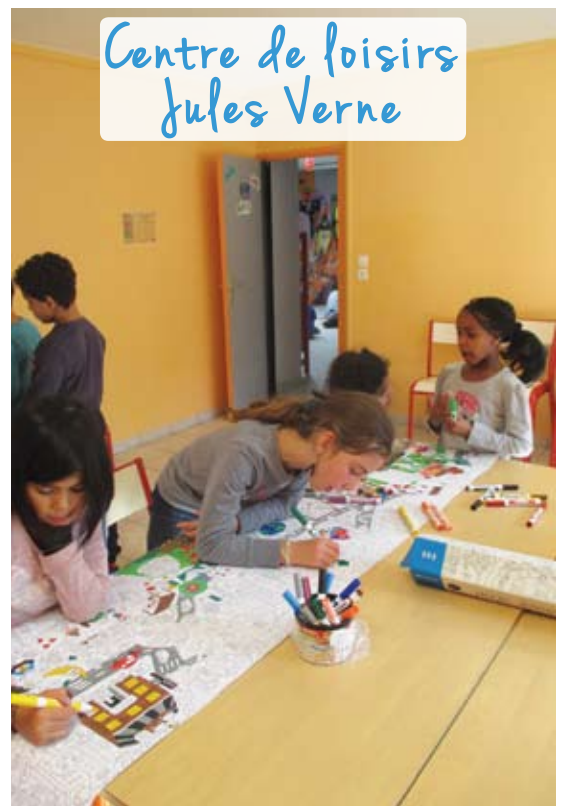
Centre de loisirs Jules Verne