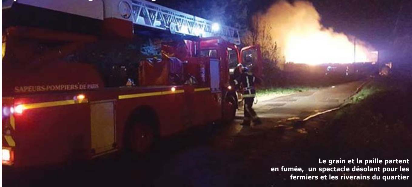
Le grain et la paille partent en fumée, un spectacle désolant pour les fermiers et les riverains du quartier

C'est vers 18h le jeudi 19 novembre que beaucoup de Plesséens ont entendu de forts crépitements en provenance « du fond du Plessis ». Seulement quelques jours après les événements parisiens du vendredi 13, l'inquiétude a très vite gagné un grand nombre d'esprits. Heureusement, en informant dès 18h15 qu'il s'agissait de l'incendie d'un hangar de la ferme, le service communication, via la page facebook