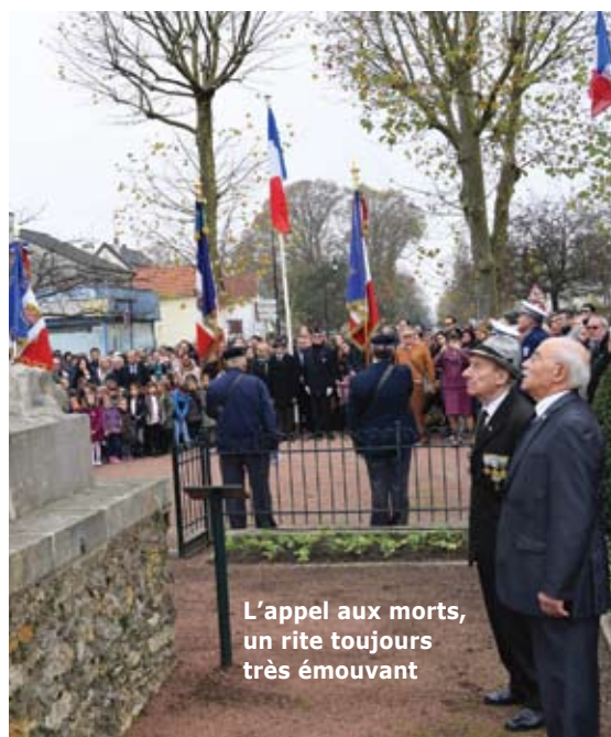
L'appel aux morts, un rite toujours très émouvant