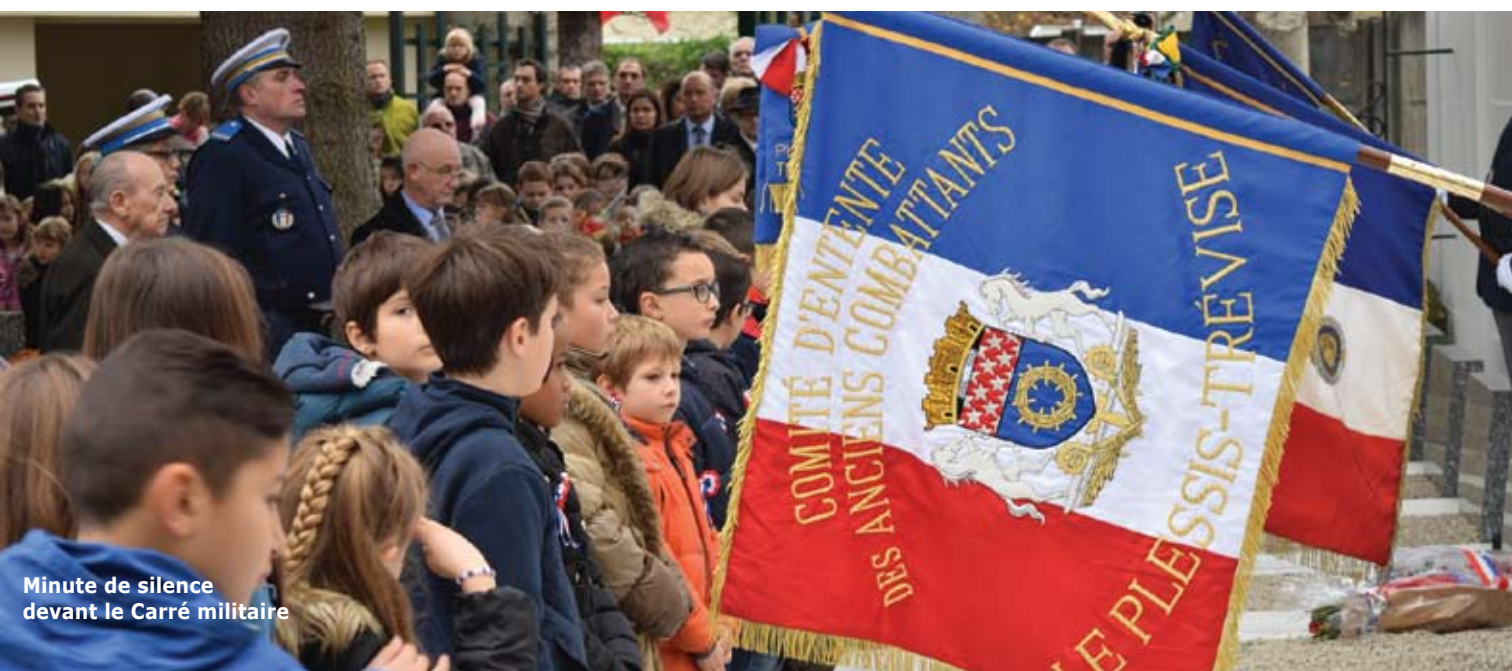
Minute de silence devant le Carré militaire