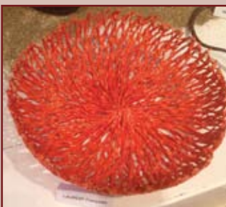
Œuvres de Françoise Laurent