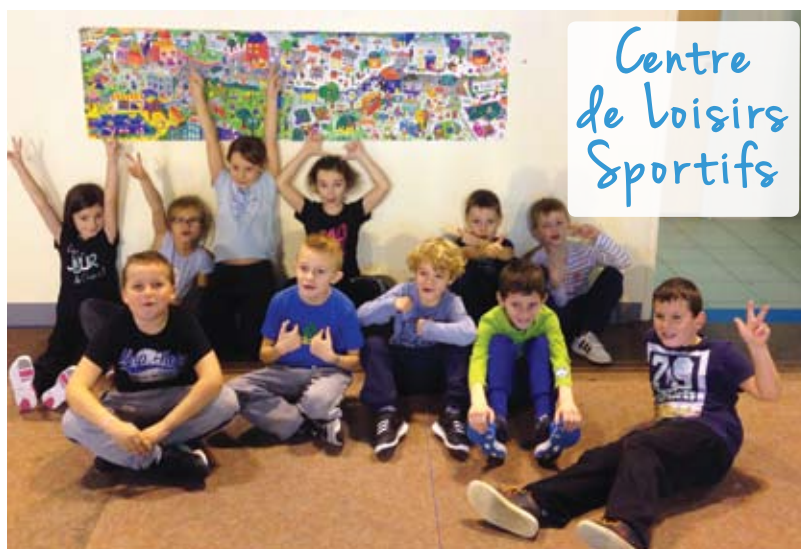
Centre de Loisirs Sportifs