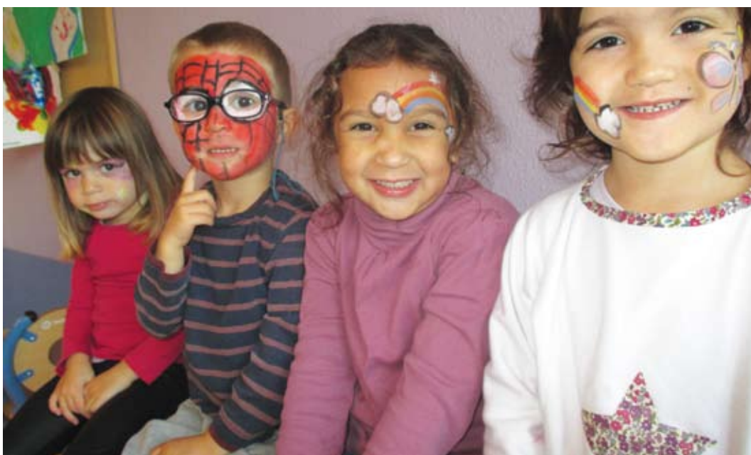
On s'éclate aussi au centre de loisirs Jules Verne