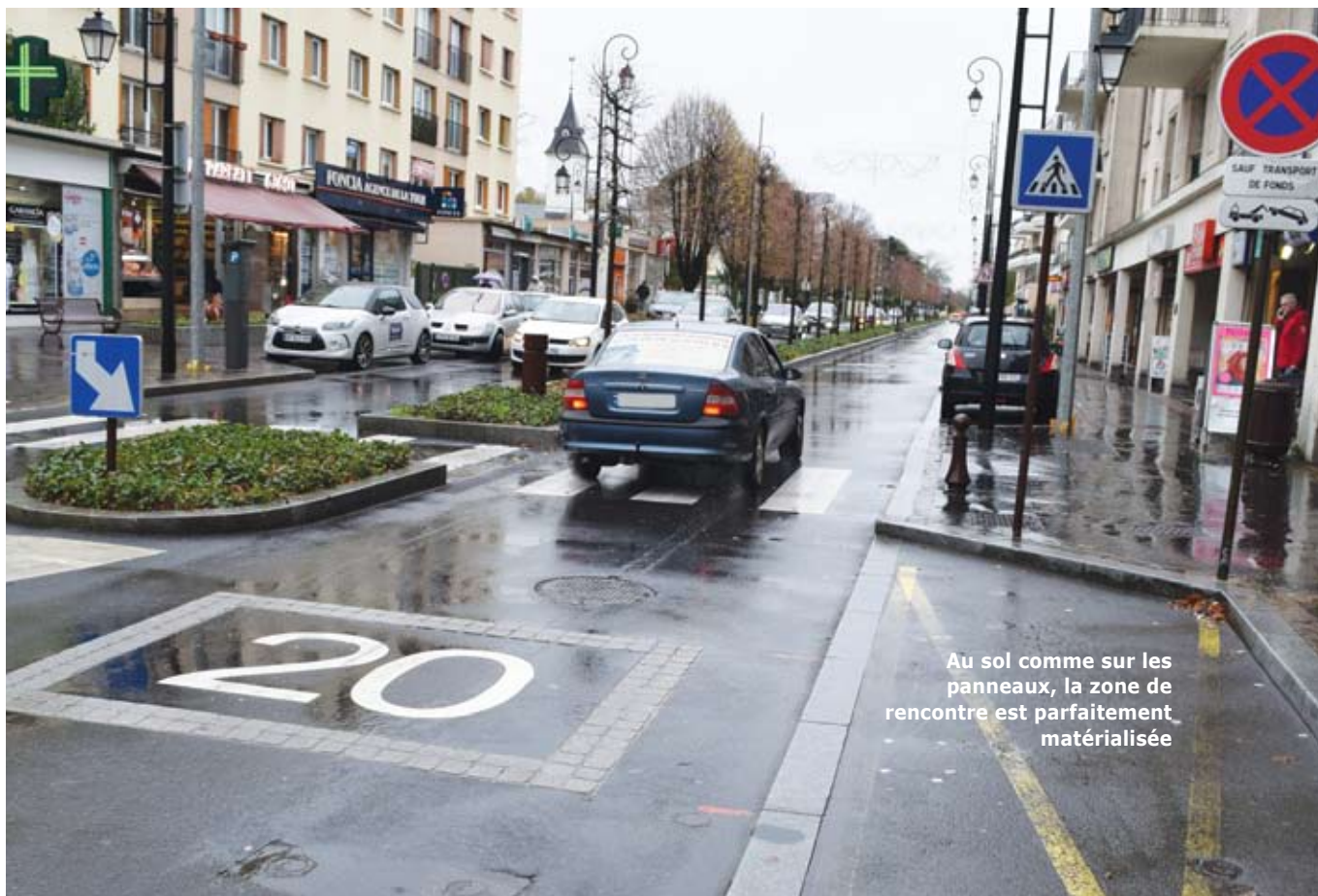
Au sol comme sur les panneaux, la zone de rencontre est parfaitement matérialisée

- Finis les dénivelés classiques entre chaussée et trottoir ! Le choix des matériaux, des textures ou des couleurs organise l'espace : moins de reliefs pour faciliter la vie aux poussettes et aux fauteuils.