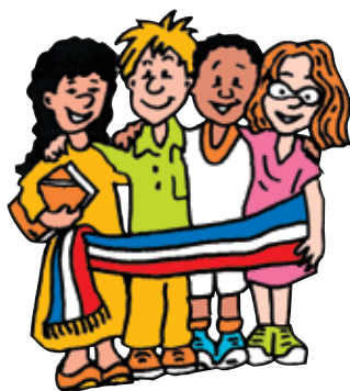
Conseil Municipal des Enfants