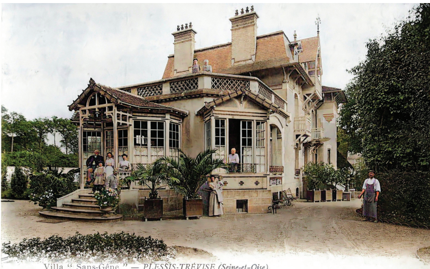
Villa " Sans-Gêne " — PLESSIS-TRÉVILLE (Seine-et-Oise).

Pour en savoir + www.memoire-du-plessis-trevice.fr