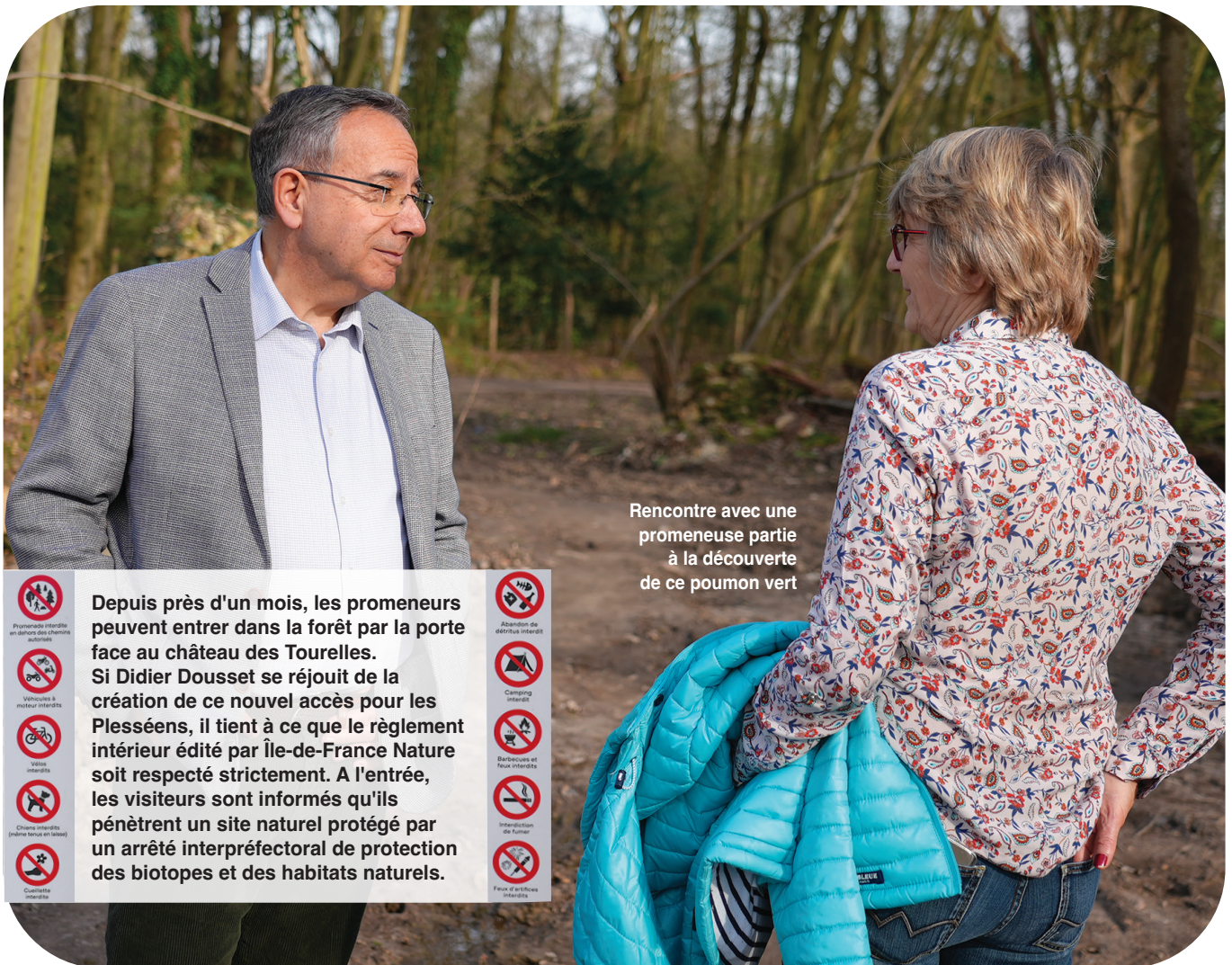
Rencontre avec une promeneuse partie à la découverte de ce poumon vert