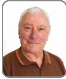
Jean-Marc Sardin Espace public et cadre de vie