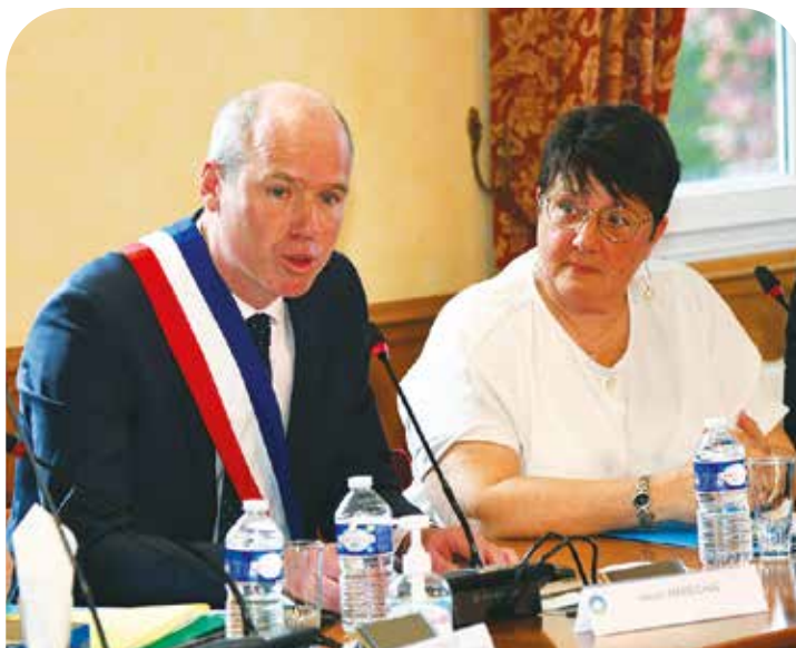
ALEXIS MARÉCHAL, MAIRE DU PLESSIS-TRÉVISÉ