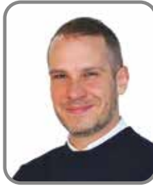
Jean-Pierre Ribeiro Équipements sportifs