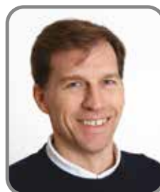
Nicolas Doisneau Vie des quartiers