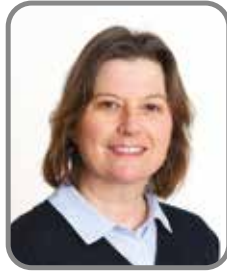
Annabelle Lion Jumelage