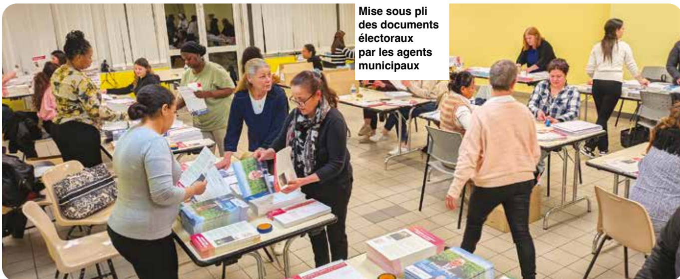
Mise sous pli des documents électoraux par les agents municipaux